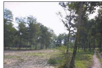
Emplacement de la résidence